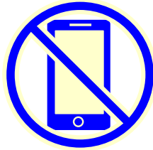
携帯電話 スマートフォン