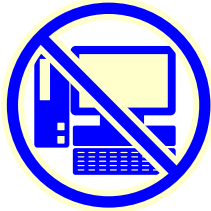
パソコン ゲーム機