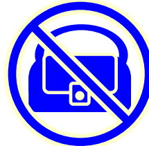
ハンドバッグの 留め具